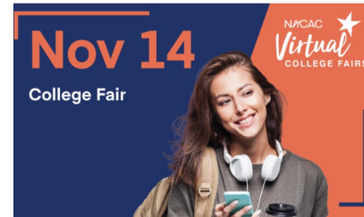
Nov 14 - Signature Fair Nov 14th 10:00 am - Nov 14th 3:00 pm PST