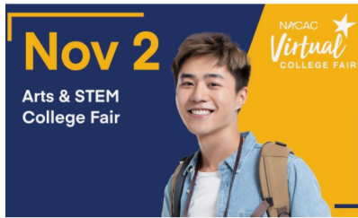
Nov 2 - Arts & STEM Fair Nov 2nd 1:00 pm - Nov 2nd 5:00 pm PDT